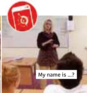
My name is ...?