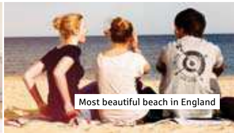
Most beautiful beach in England