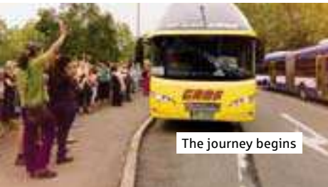
The journey begins

Teilnahmebedingungen: Veranstalter dieses Gewinnspiels ist die Deutsche Sparkassen Verlag GmbH, Stuttgart, in Kooperation mit alibion language tours, Paderborn. Am bundesweiten Gewinnspiel und an der Reise teilnehmen können alle von 14–17 Jahren. Einsendeschluss ist der 15. März 2017. Der Gewinner oder die Gewinnerin werden aus allen richtigen Einsendungen ausgelost. Der Gewinner oder die Gewinnerin wird per E-Mail benachrichtigt. Der Rechtsweg ist ausgeschlossen! Die Daten werden nur zur Ermittlung des Gewinners gespeichert und anschließend gelöscht. Die Reise muss zu einem der angebotenen Reiseternine angetreten werden.